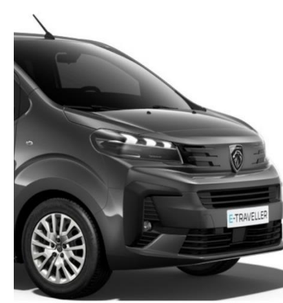
Сив металик Gris Titane (M01J)