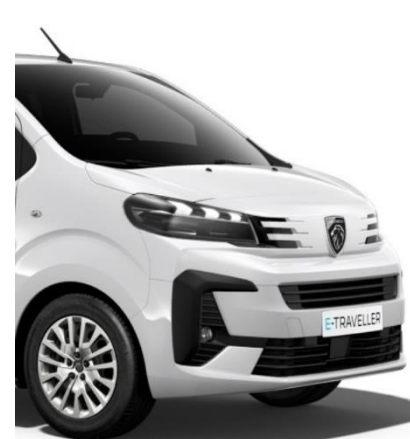
Бял неметалик Icy White (P0PR)