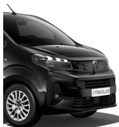
Черен металик Perla Nera (M09V)