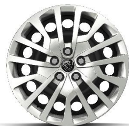
17" стоманени джанти с декоративни пълноразмерни тасове