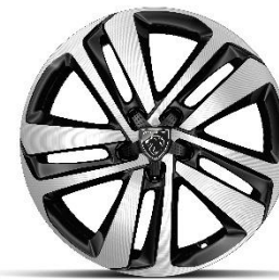
17" алуминиеви джанти с диамантен ефект