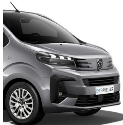
Сив металик Arctic Steel (M0F4)