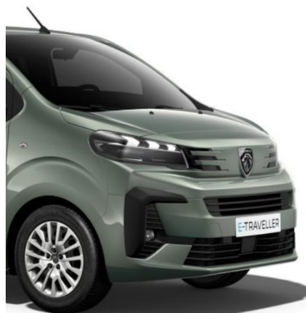
Зелен металик All-Terrain Green (MODU) Без Expert Combi